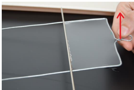
obr. 4 – dvíhanie slučky