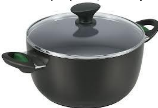
Obr. 4.1 Hrnec s plastovými ušami ( http://goo.gl/P1YdiA )

Na niektorých hrncoch sú uši kovové, na iných plastové (obr. 4.1). Ktoré považuješ za výhodnejšie? Navrhni experiment, ktorým by si svoje tvrdenie podložil.