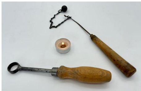
Obr. 4.14 Gulôčka na retiazke a krúžok

gulôčka na retiazke a krúžok (obr. 4.15), statívový materiál, bimetalický pásik, papierik zo žuvačky, pinzeta, kahancová sviečka