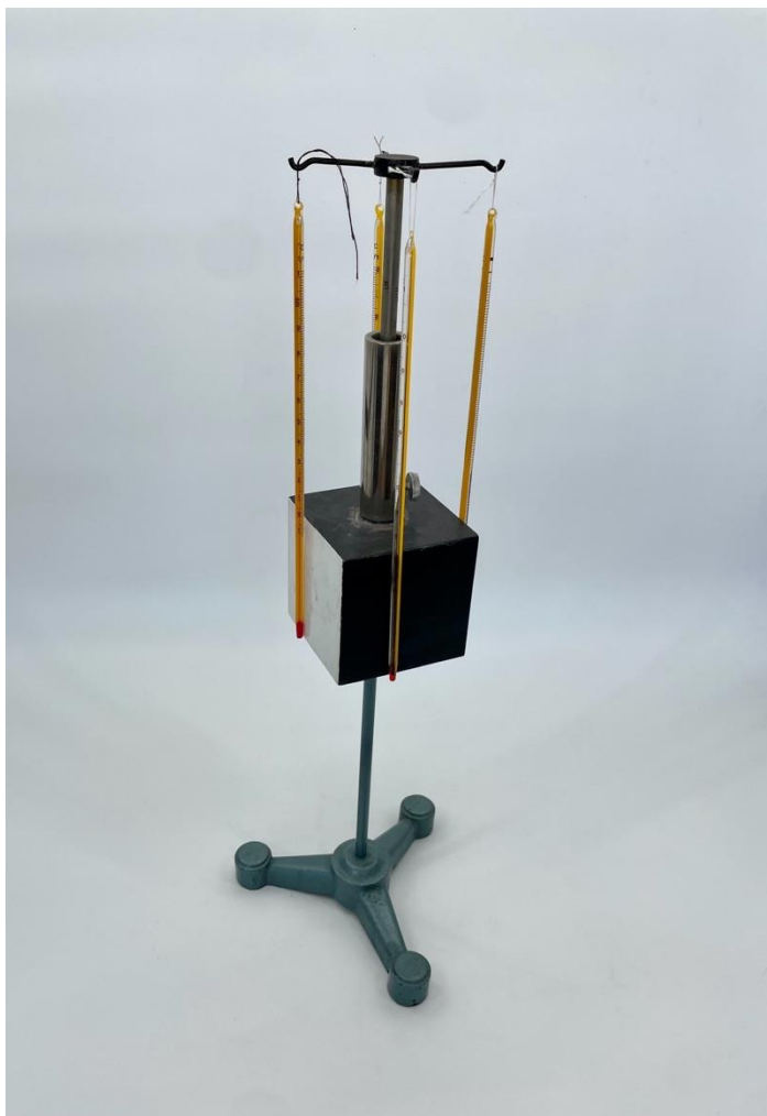
Obr. 4.13 Zisťovanie závislosti teploty plochy v závislosti od kvality povrchu