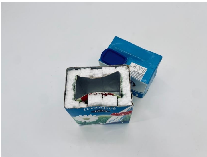
Obr. 4.5 Jednoduchý kalorimeter