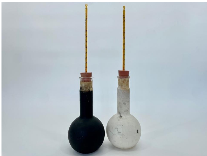
Obr. 4.12 Zisťovanie teploty vody v závislosti od povrchu banky