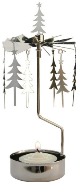
Obr. 4.2 Vianočný svietnik ( http://goo.gl/PIDQ6G )

Počas vianočného času atmosféru spríjemňujú sviečky. Niektoré z nich môžu byť umiestené vo svietniku, ktorý je na obr. 4.2. Po zapálení sviečky sa vrtuľka na vrchu svietnika začne pomaly otáčať. Vieš vysvetliť prečo?