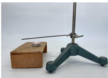
Obr. 4.15 Bimetalický pásik