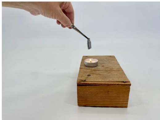
Obr. 4.16 Špirála z papierika od žuvačky