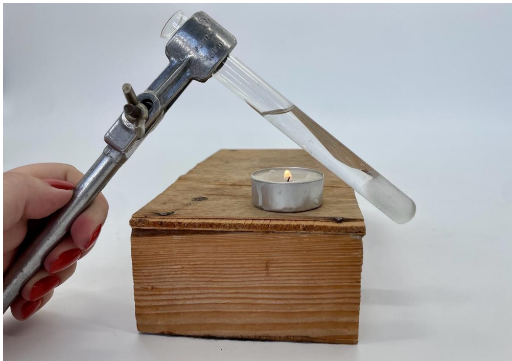
Obr. 4.9 Pokus so zohrievaním vody v skúmavke