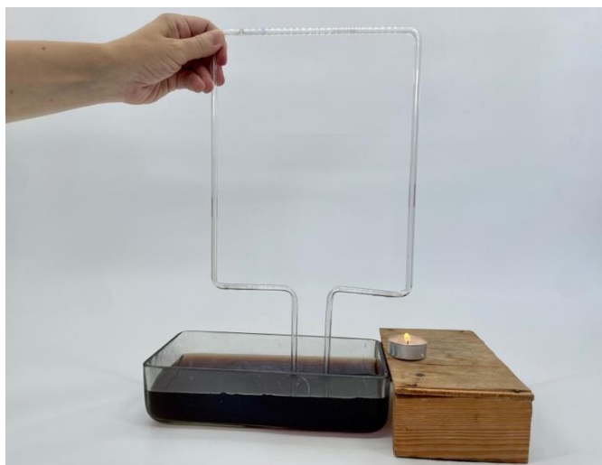
Obr. 4.10 Zostavenie pomôcok pri pokuse so zahnutou trubicou