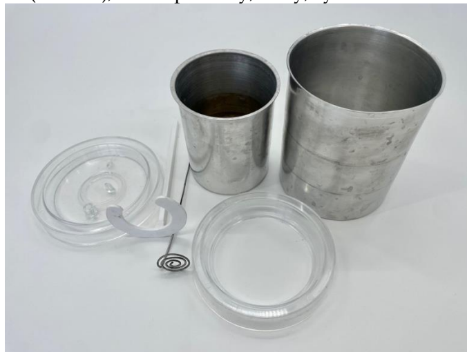
Obr. 4.7 Zmiešavací kalorimeter

zmiešavací kalorimeter (obr. 4.7), dva teplomery, váhy, rýchlovarná kanvica, kovový predmet