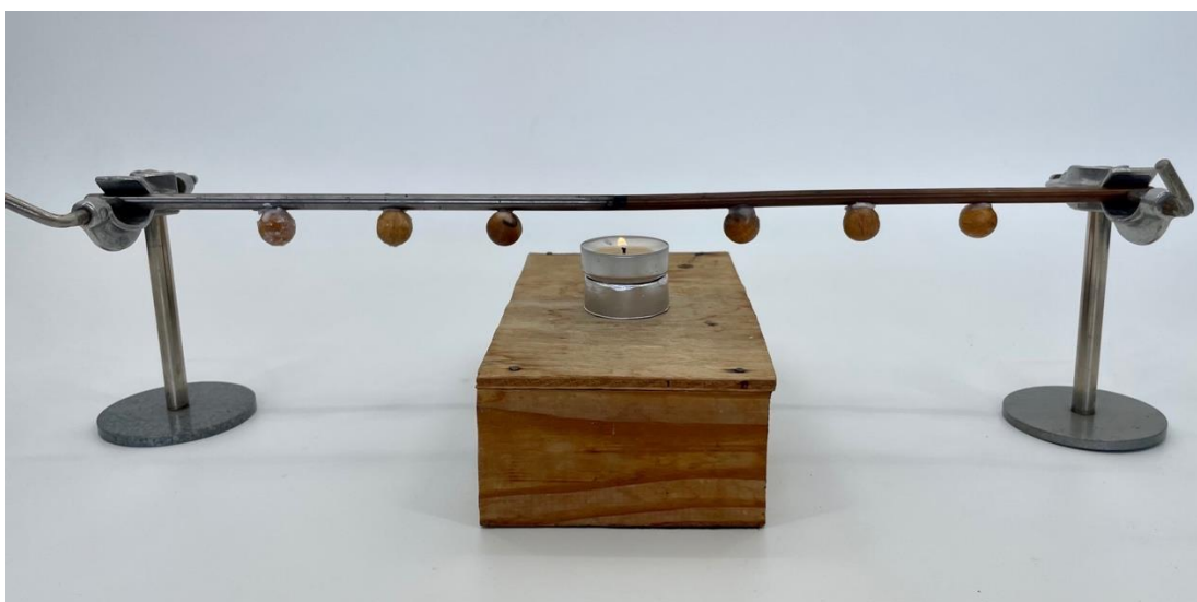
Obr. 4.8 Aparatúra na demonštráciu rôznej tepelnej vodivosti kovov