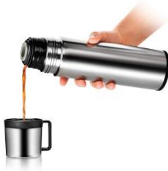
Obr. 4.4 Termoska ( http://goo.gl/gLl7Fh )

Termoska slúži na uchovávanie teploty horúcich alebo studených nápojov (obr. 4.4). Ako by si otestoval, či termoska zabraňuje tepelnej výmene?