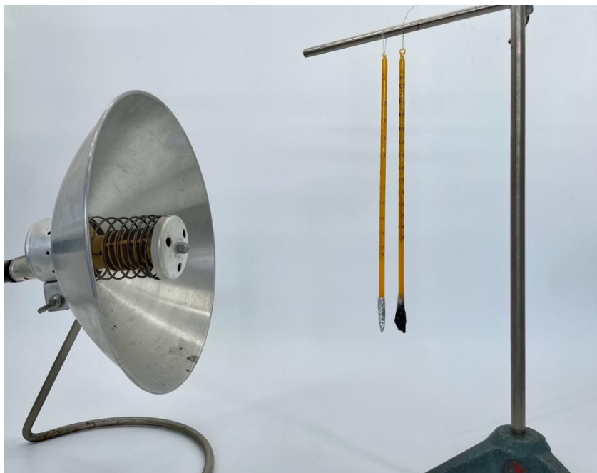
Obr. 4.11 Zisťovanie závislosti teploty od materiálu, ktorým je obalený teplomer